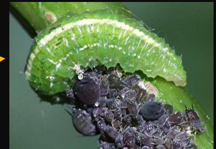
Larve de syrphe

Plusieurs sont carnivores à l'état larvaire et se nourrissent principalement de pucerons.