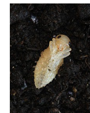
Le nympe de la cicindèle