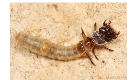
La larve de la cicindèle