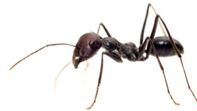
C'est ce quelle chasse

Finalement, je vais vous parler de ses faits étonnants et de son alimentation. Elle chasse d'autres insectes. C'est l'insecte le plus rapide du monde. Il avance à 700 km à l'heure. C'est un insecte exceptionnel qui attrape ses proies grâce à ses sabres à l'avant.